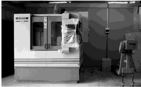
Обрабатывающий центр "RAIS" М-450

В настоящее время сотрудники модельного производства осваивают изготовление сложных пресс-форм, изучают технические возможности станка. В течение года представителями программы "Азизин-Грант" будут отслеживаться работы компании, эксплуатация обрабатывающего центра, создание новых рабочих мест, прибыльность проекта. Наша задача сейчас, в том числе, - соответствовать всем предъявляемым к участникам программы требованиям.