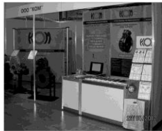
Выставочный стенд ООО «КОМ»

Также была достигнута договоренность с представителями ОАО "РИАТ" о передаче им на испытание раздаточной коробки МП2200-1800020 и КОМ МП26-4204010-50.